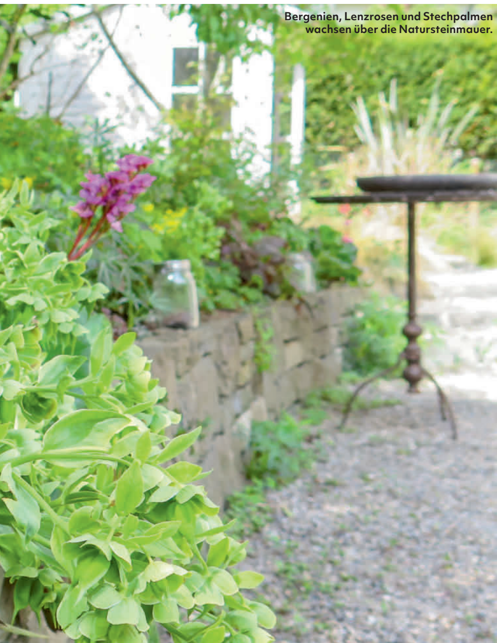
Bergenieen, Lenzrosen und Stechpalmen wachsen über die Natursteinmauer.