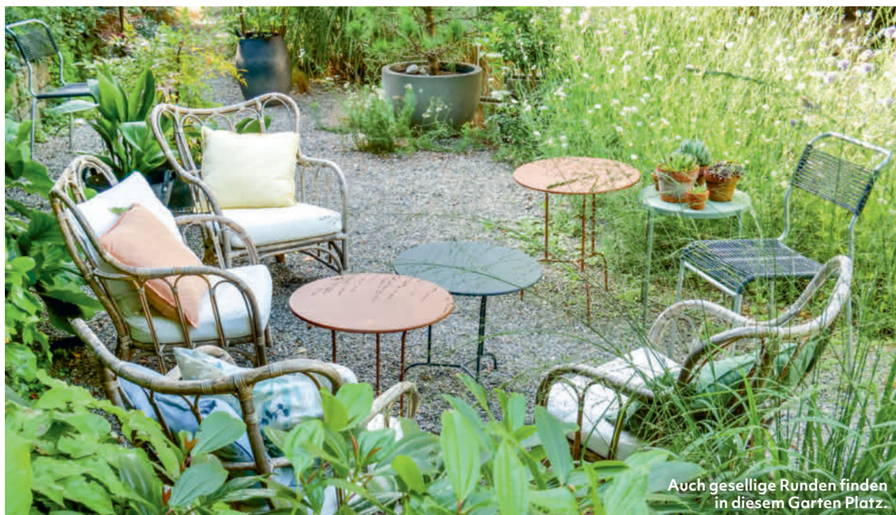
Auch gesellige Runden finden in diesem Garten Platz.