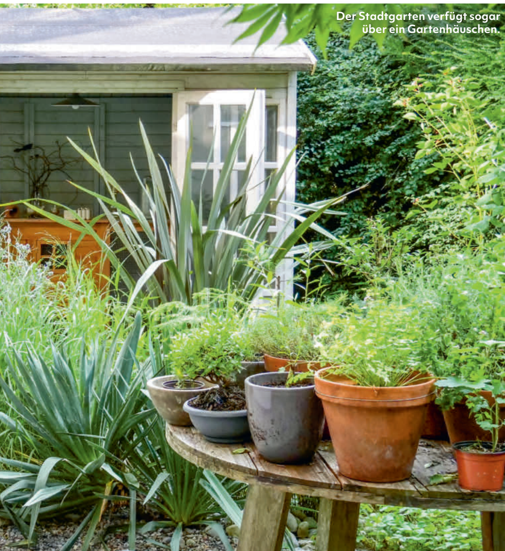
Der Stadtgarten verfügt sogar über ein Gartenhäuschen.