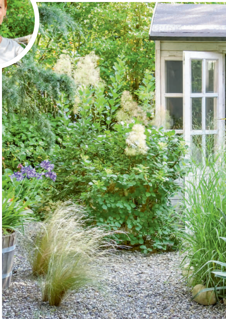
Mehrere Sorten von Elfenblumen zieren die Pflanzflächen.

Je kleiner die Fläche, desto graziler und leichter sollten die Möbel sein. Ich wähle jeweils Stücke, die man gut herumtragen kann. Es lohnt sich zudem, in hochwertiges Mobiliar zu investieren, an dem man lange Freude hat. Das ist nachhaltiger, als immer wieder Neues zu kaufen. Dafür sollte man nicht zu viele Terrassenmöbel wählen, damit nicht alles vollgestellt ist.